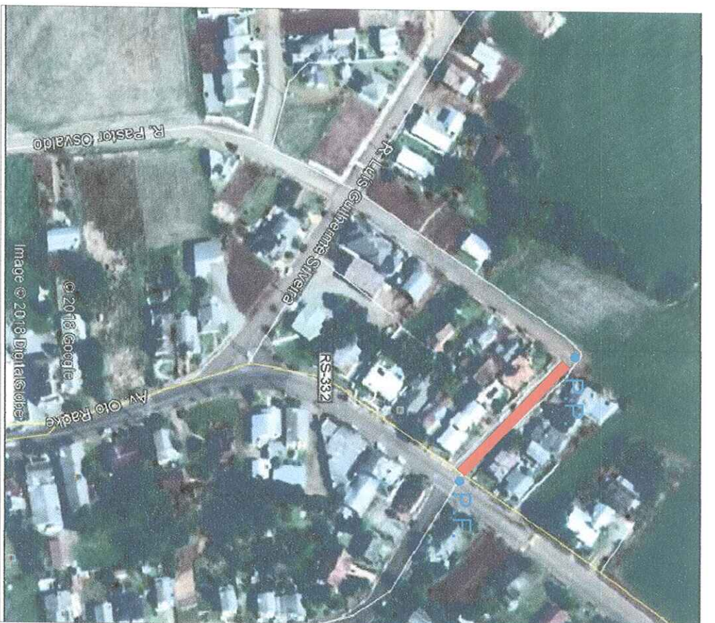
LOCALIZAÇÃO Imagem do Google Sem escala