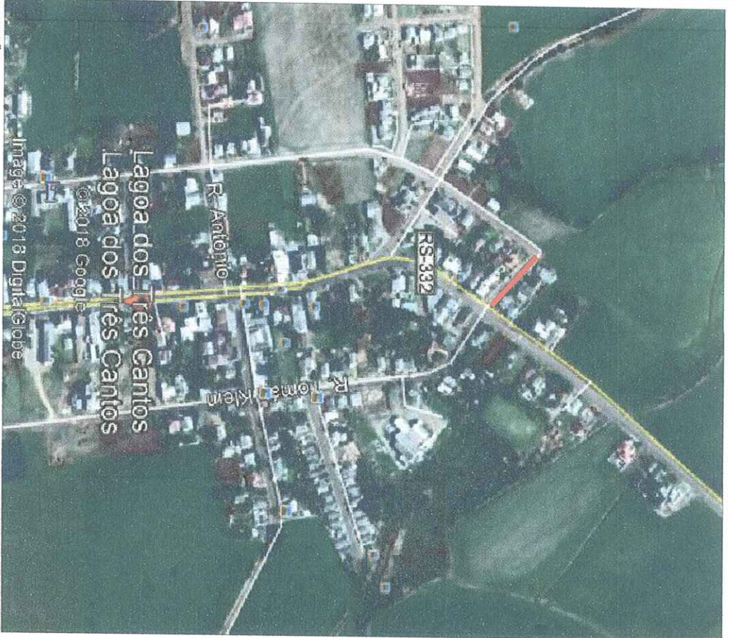
SITUAÇÃO Sem escala