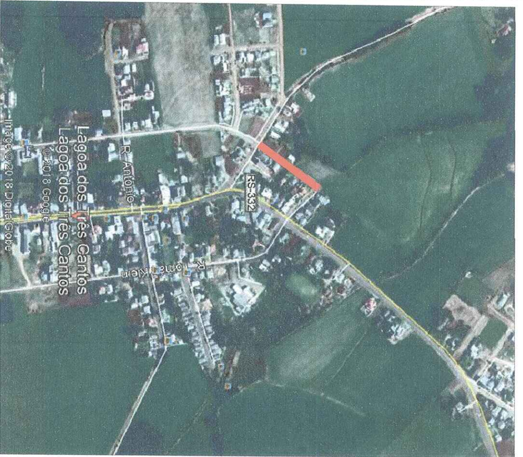
SITUAÇÃO Sem escala