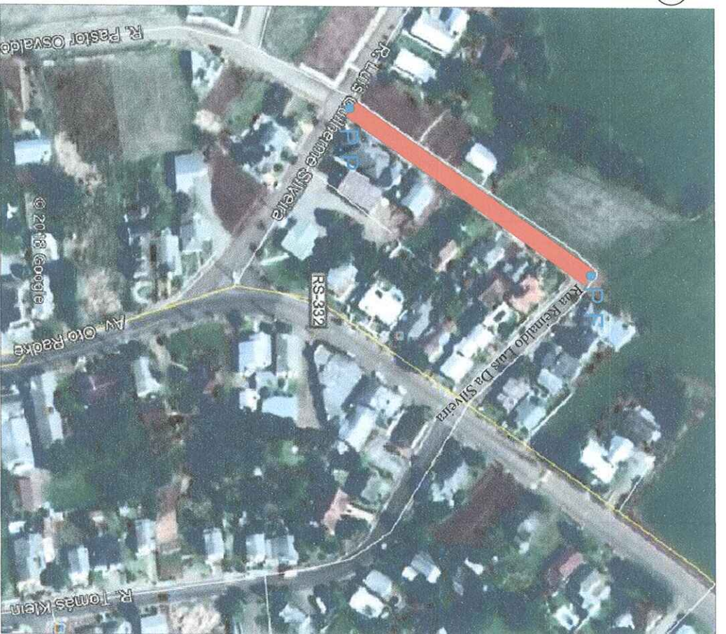
LOCALIZAÇÃO Imagem do Google Sem escala