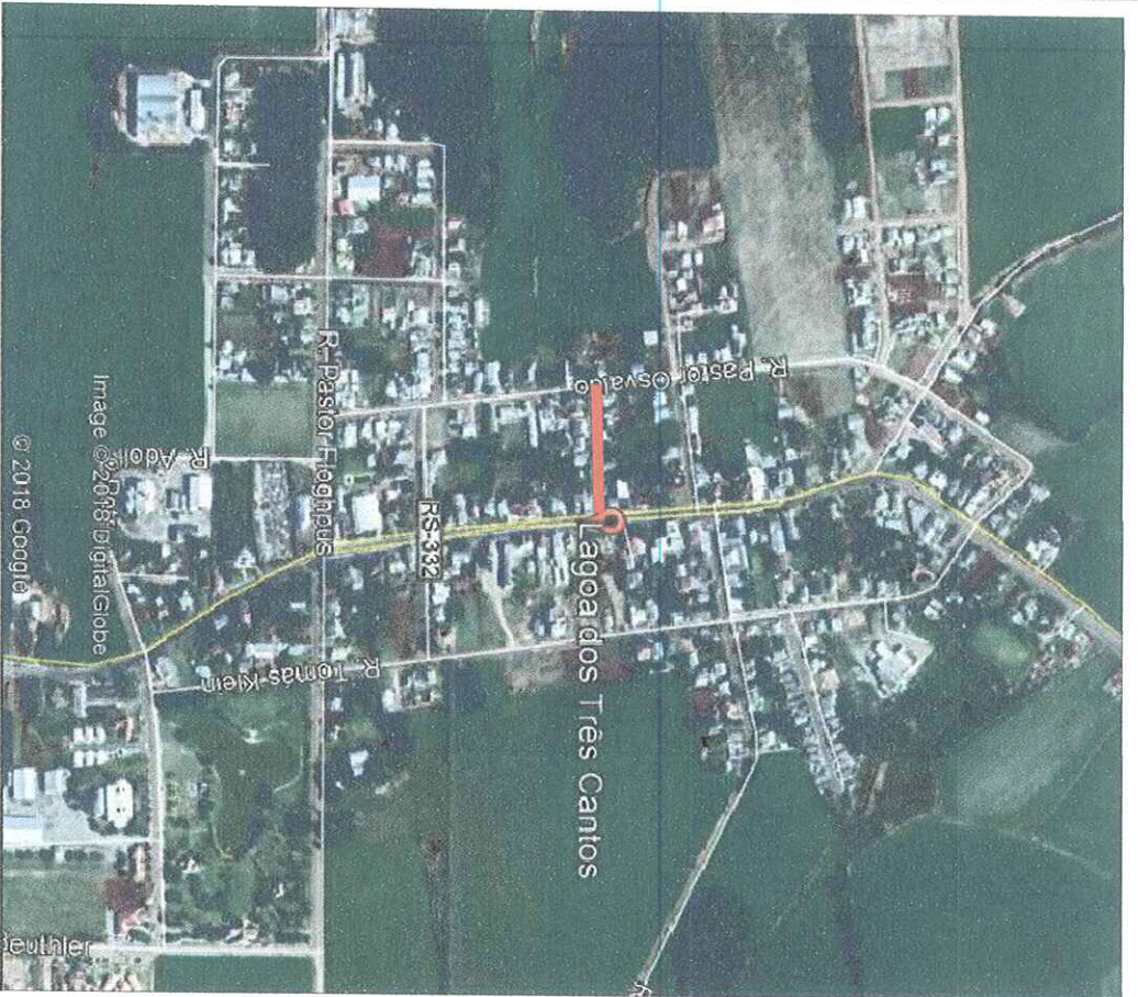
SITUAÇÃO Imagem do Google Sem escala