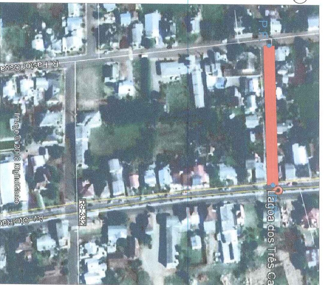
LOCALIZAÇÃO Sem escala