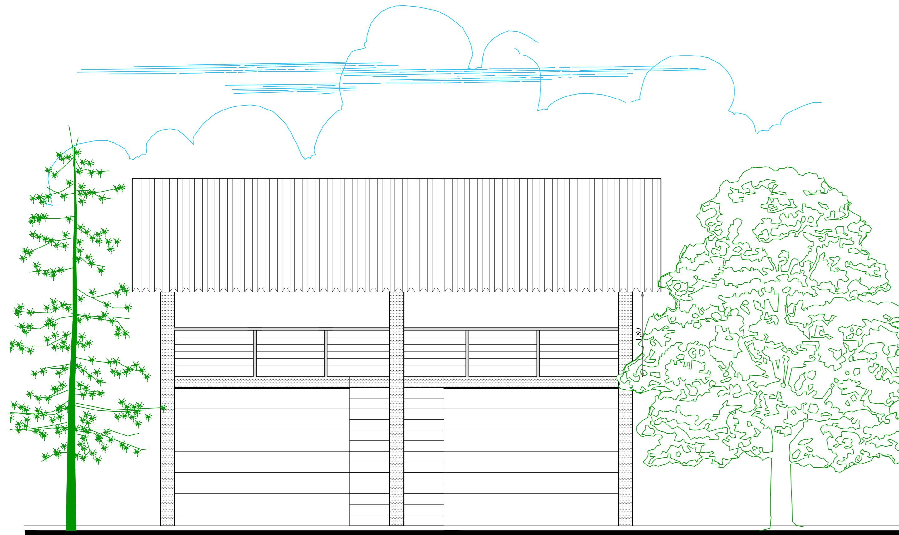
FACHADA FRONTAL ESCALA: 1/50