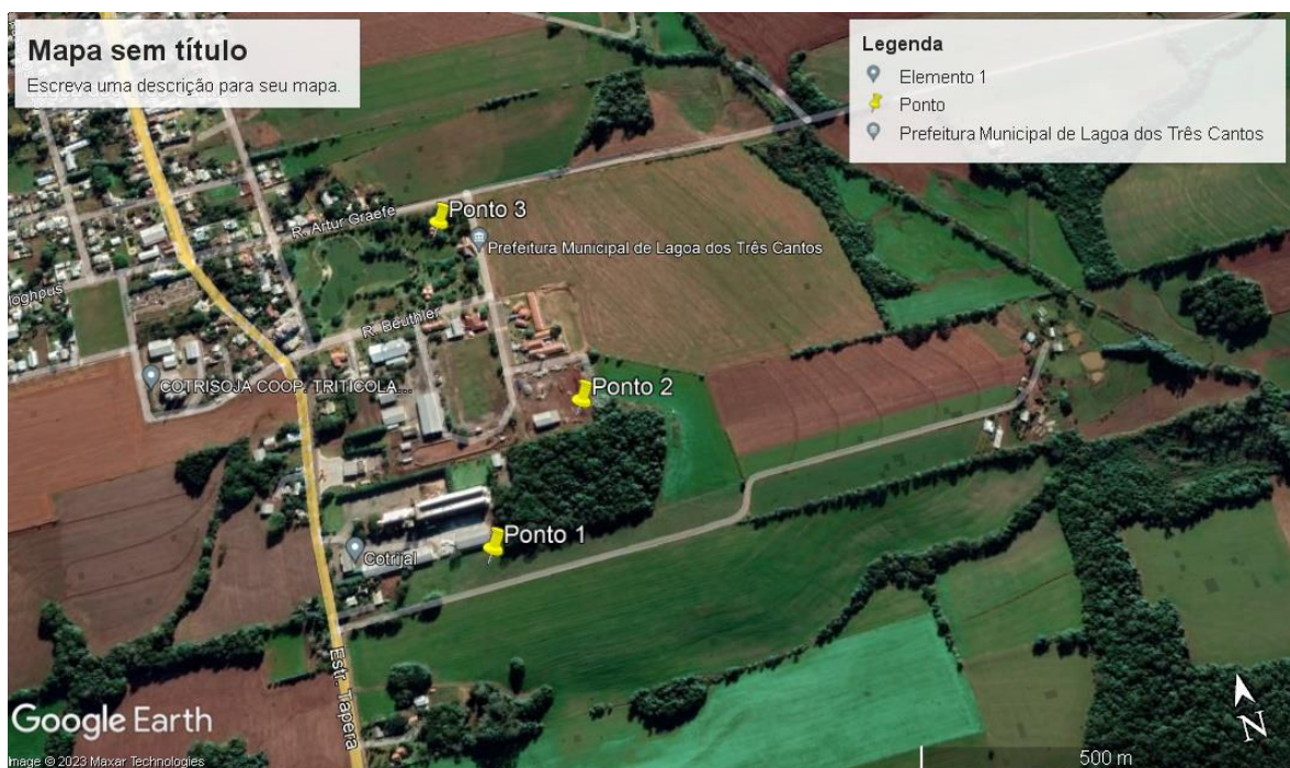
Figura 01: Ilustração do Google Earth, indicando os pontos escolhidos prioritários para a perfuração.

O Primeiro Ponto visitado está no terreno da Secretaria do Obras da Prefeitura Municipal de Lagoa dos Três Cantos. O segundo ponto de interesse está no interior do pátio da Secretaria de Obras, por fim, o último ponto está localizado na praça central da cidade, figura 01.